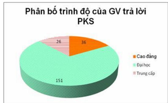
Hình 1. Trình độ của giáo viên trả lời phiếu khảo sát

Số liệu khảo sát cho thấy tất cả giáo viên có đủ độ hiểu biết về tâm lý và sự phát triển của trẻ mầm non theo từng lứa tuổi giúp họ thực hiện tốt chương trình giáo dục kỹ năng sống cho trẻ mầm non nói chung và cho trẻ lớp lá 5 – 6 tuổi nói riêng.