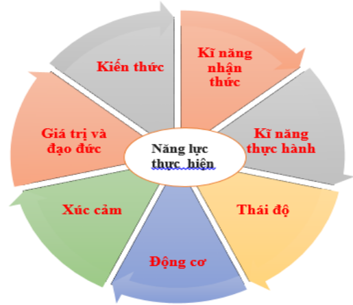
Hình 2. Các thành tố của năng lực cần thiết trong hoạt động dạy học

sống của người học (có được trải qua quá trình trải nghiệm cuộc sống); 3) Thái độ (hứng thú, tích cực, sẵn sàng và chấp nhận thách thức, ...); 4) Động cơ học tập; 5) xúc cảm (Yêu thích khoa học, văn chương, nghệ thuật, ...); 6) Giá trị (yêu gia đình và bản thân, tự tin, ý thức, trách nhiệm,...); 7) Đạo đức (cách ứng xử trong gia đình và xã hội). Các thành tố này được đặt trong bối cảnh và tình huống thực tiễn (hình 2).