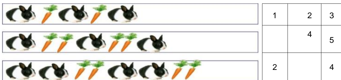
Hình 1: Trò chơi dạng thiếu thừa

Mục đích: giúp trẻ phát triển khả năng quan sát tìm ra các quy luật sắp xếp trong toán học.